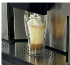
En varm cappuccino?

Ett antal olika moduler och tillval finns att välja emellan när det gäller denna fantastiska modell. Kontakta oss gärna för diskussioner och frågor ang. vilka möjligheter som finns.